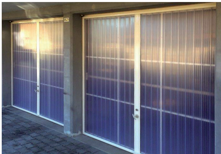
separo transparent ist lichtdurchlässig und schwach durchsichtig.

separo eignet sich ideal für Torfüllungen und zum bestücken von Trennwänden oder Wandelementen. Beim Bau von Industrie-, Lager- oder Agrarhallen, Waschstrassen und Werkstätten kommen separo Doppelwandelemente zum Einsatz. Ein Metallrahmen aus U-Profilen eignet sich zum Einfassen der doppelwandigen Hart-PVC Profile. Die schnelle, unkomplizierte Montage dank Nut-Kamm Steckverbindungen machen separo zur Nummer 1 für vielseitige und nutzbringende Anwendungen bei Neubauten oder Renovationen. Die transparente Ausführung erlaubt Ihnen, genügend Licht ins Rauminnere zu bringen zum Beispiel mit einem Lichtband.