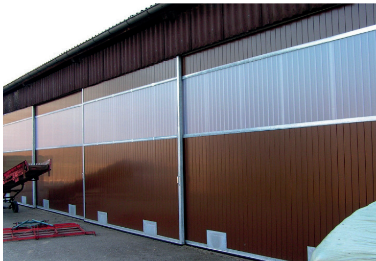
Metallrahmen mit separo-Füllung sind vielseitig einsetzbar und sehr resistent.