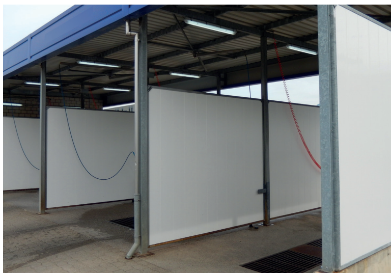
separo ist einfach zu Reinigen.

Ausgediente Profile können sortengetrennt dem Recycling zugeführt werden.